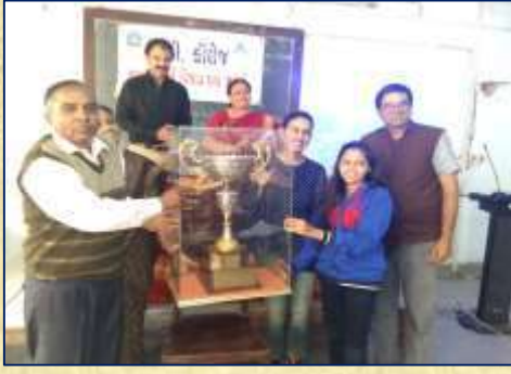
યુવા ઉત્કર્ષ વિજય પદ્મ સ્પર્ધા