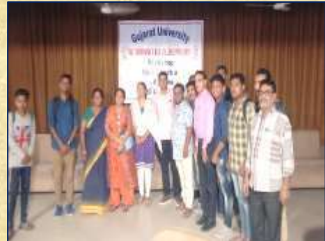
યુવક મહોત્સવ વર્કશોપ