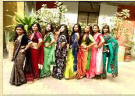
સાડી ડે ની ઉજવણી