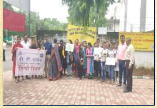
હિન્દી દિવસ રેલી