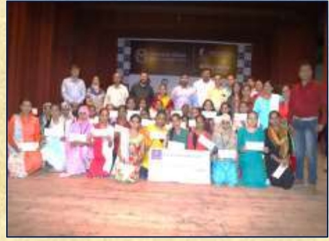
માલાબાર દ્વારા ૩૩ વિદ્યાર્થીનીઓને ૧,૬૫,૦૦૦ ની સ્કોલરશીપ વિતરણ