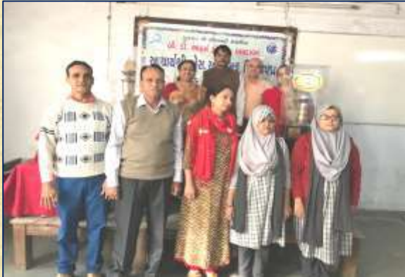
સ્વ. પ્રિ. એસ. આર. ભટ્ટ વક્તૃત્વ સ્પર્ધા