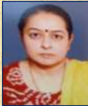
ડૉ. ધરતી ગજજર હોમ સાયન્સ