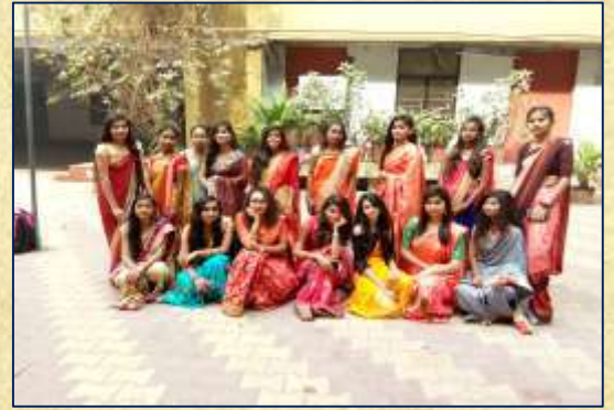
સાડી ડે ની ઉજવણી