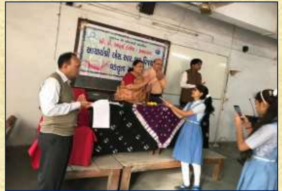
સ્વ. પ્રિ. એસ. આર. ભટ્ટ વક્તૃત્વ સ્પર્ધા