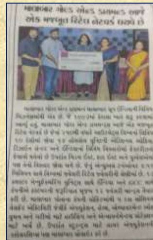
માલાબાર દ્વારા સ્કોલરશીપ વિતરણ