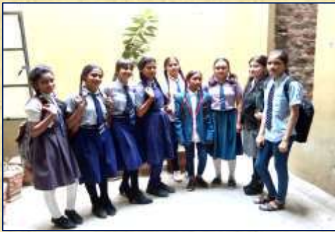
સ્કૂલ ડે ઉજવણી