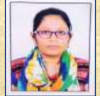
Tank Hetal Sem.4 Uni. 37 Rank